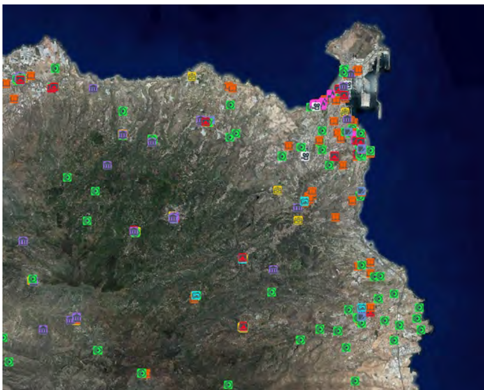
Espacios culturales en el visor de Grafcan