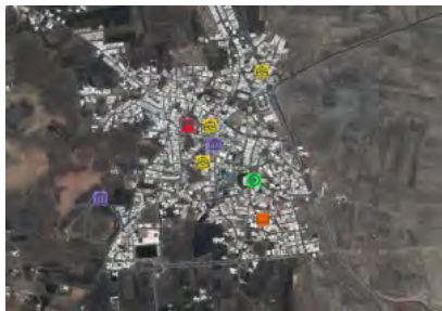
Detalle del visor de Grafcan.

centros de este tipo, concretamente 1.511, en el Archipiélago.