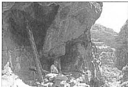
Barranco El Hoyo. Maleo en Paso de la Escalera (Tijarafe).