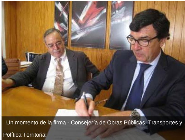
Un momento de la firma - Consejería de Obras Públicas, Transportes y Política Territorial