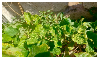
Imagen de un caso de filoxera en Tenerife.

Por su parte, en Gran Canaria se han realizado 198 prospecciones en 12 municipios por parte del Cabildo, y hasta el momento todas han dado negativo. En Lanzarote se han efectuado 59 prospecciones en tres municipios a cargo del Gobierno de Canarias, con resultados negativos hasta ahora. Estas prospecciones se han llevado a cabo aunque, al parecer, no existan indicios de presencia de filoxera. Según el Ejecutivo canario, “una vigilancia activa es la única estrategia eficaz para evitar la propagación” de esta plaga, lo que justifica la realización de estos controles preventivos en las islas.