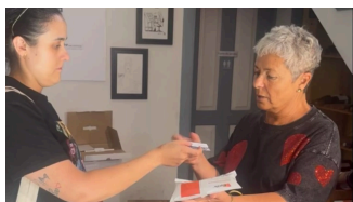
Entrega del tratamiento que busca blindar los viñedos de Tenerife frente a la filoxera.

En relación con las ayudas económicas, hasta ahora se sabe que el presupuesto del Cabildo para 2026 contempla una partida de 1,5 millones de euros destinada a este sector, aunque aún no se han detallado los criterios de distribución.